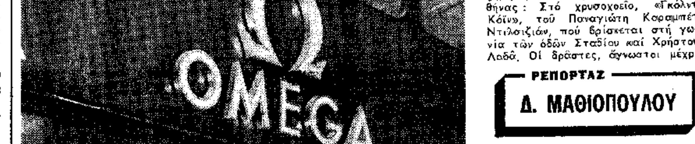
Από αυτή την προχειροδωλημή πόστα μπήκαν οι διαρρηκτες στο κεντρικό χρυσοχοείο της οδού Σταδίου

150 ΧΡΥΣΑ ΡΟΛΟΓΙΑ, 400 ΔΑΚΤΥΛΙΑ ΜΕ ΜΠΙΡΙΑΝ, 15 ΠΕΡΙΔΕΡΑΙΑ ΚΑΙ 20 ΧΡΥΣΟΥΣ ΑΝΑΠΗΡΕΣ